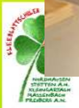
4. Regionaler Bildungskongress, Eppingen, 17. März 2007