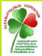
4. Regionaler Bildungskongress, Eppingen, 17. März 2007